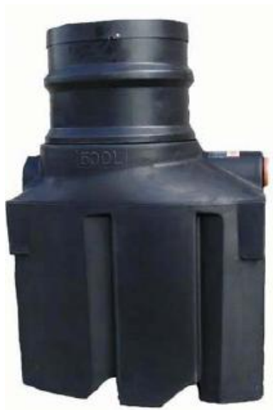
Imagen 7 (EP. VV2)