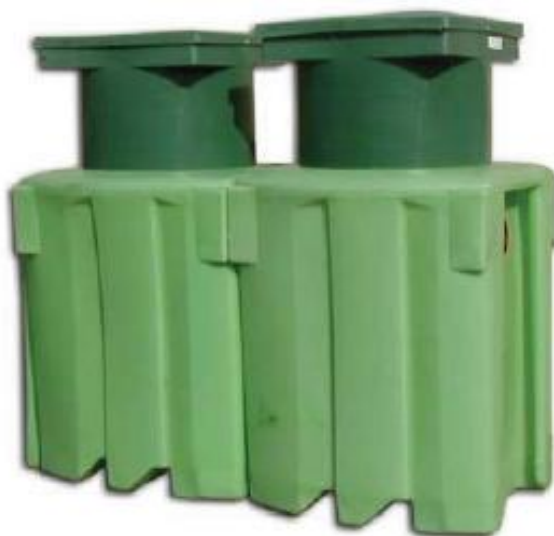
Imagen 8 (EP. VVAS2)